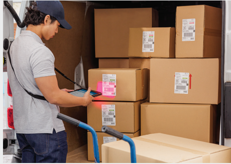
Service sur le terrain